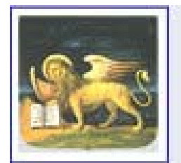
CONSIGLIO REGIONALE DEL VENETO