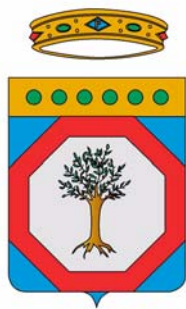
CONSIGLIO REGIONALE DELLA PUGLIA